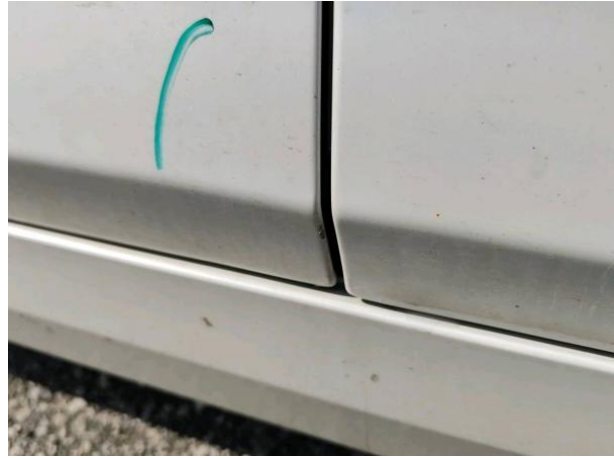
Slika R03-1: Poškodba