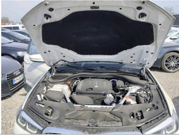
Slika M01: motorni prostor