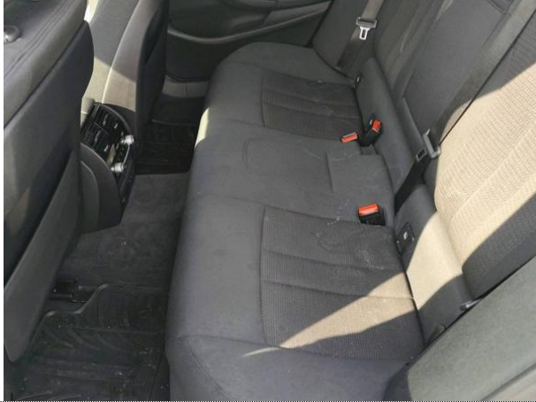
Slika N03: zadaj levo