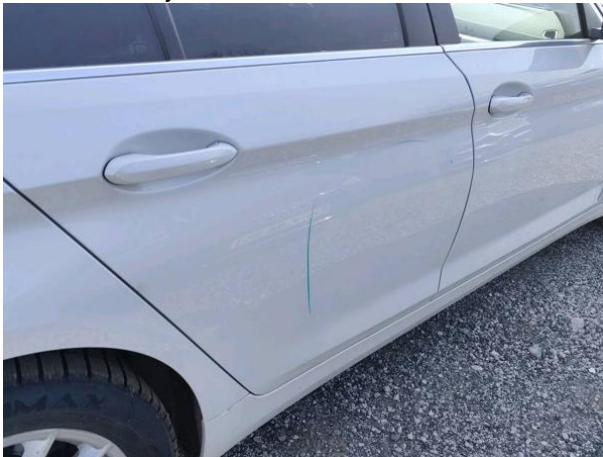
Slika R04: Zadnja vrata desna