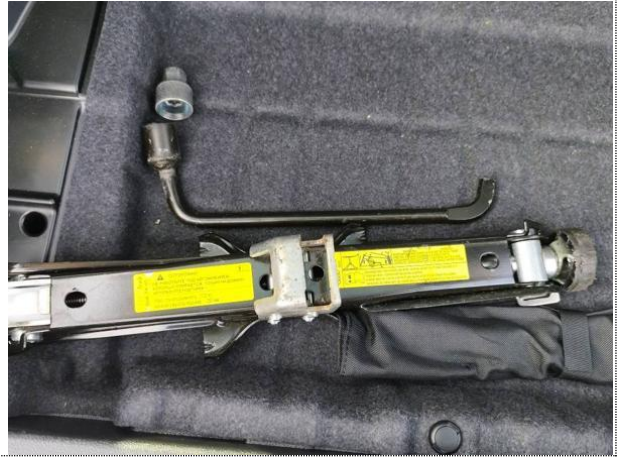
Slika 003: set za premontažo pnevmatike