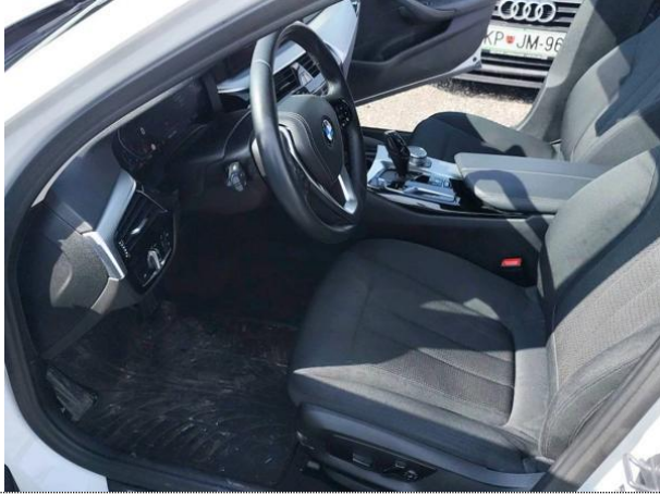
Slika N01: spredaj levo