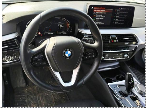
Slika N02: volan z opremo