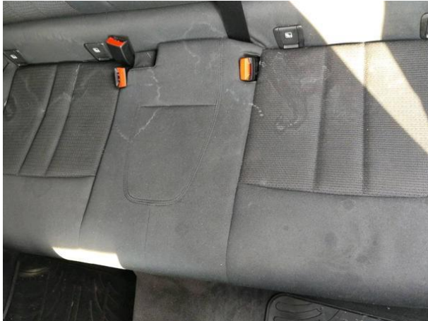
Slika N05: Zadnji sedeži