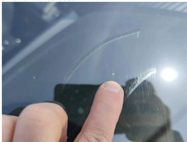
Slika R01-1: Poškodba