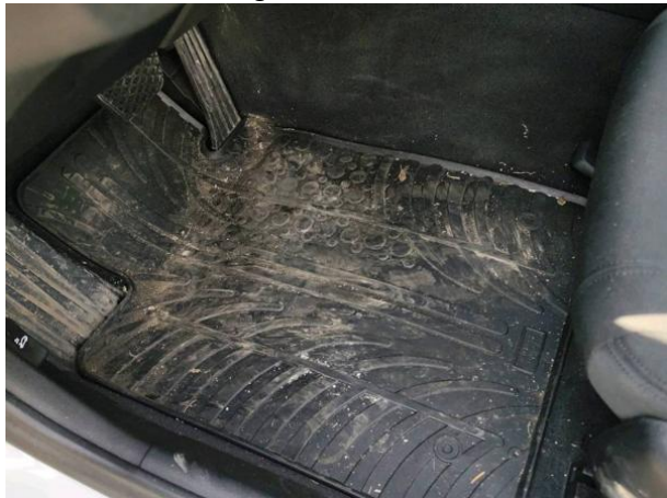
Slika N07: Talna obloga