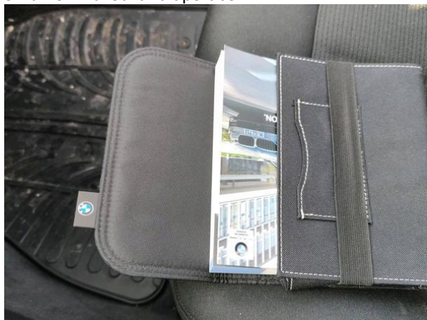
Slika D01: navodila za uporabo