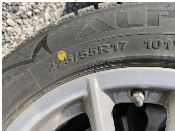
Slika G03: 2. os dimenzija