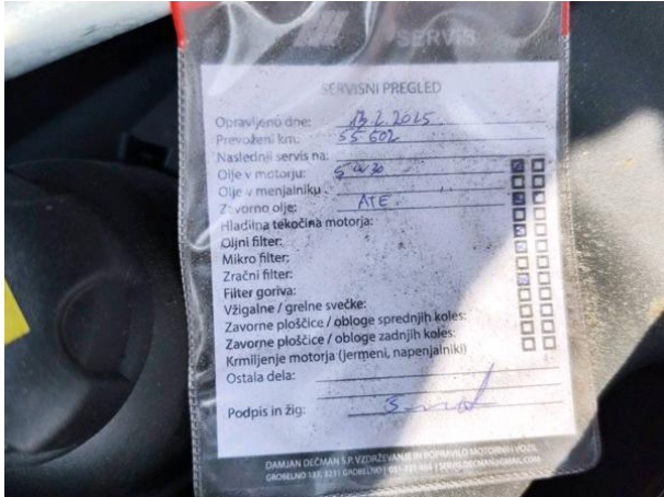
Slika M03: servisni listek