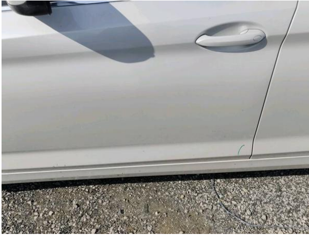
Slika R03: Sprednja vrata leva