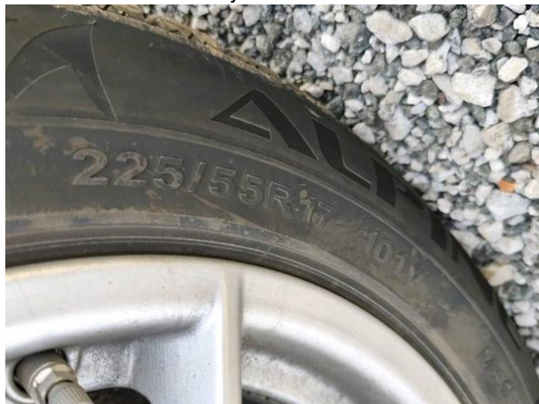
Slika G01: 1. os dimenzija