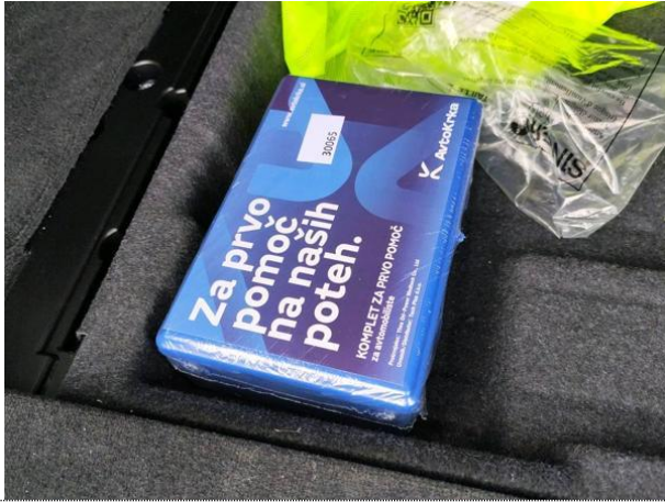
Slika 001: obvezna oprema