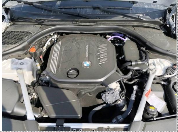
Slika M02: motor