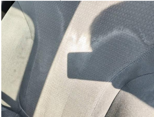
Slika N06-1: Umazanija