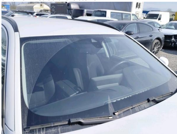
Slika R01: Vetrobransko steklo