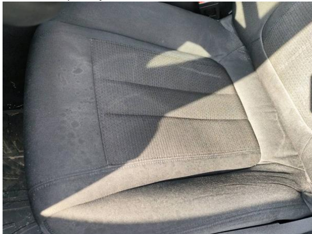
Slika N06: Sprednji levi sedež