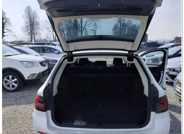
Slika N04: prtljažnik