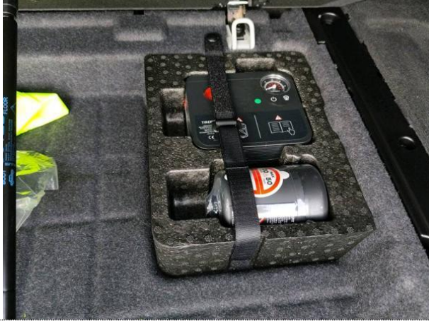
Slika 004: kit za popravilo pnevmatike