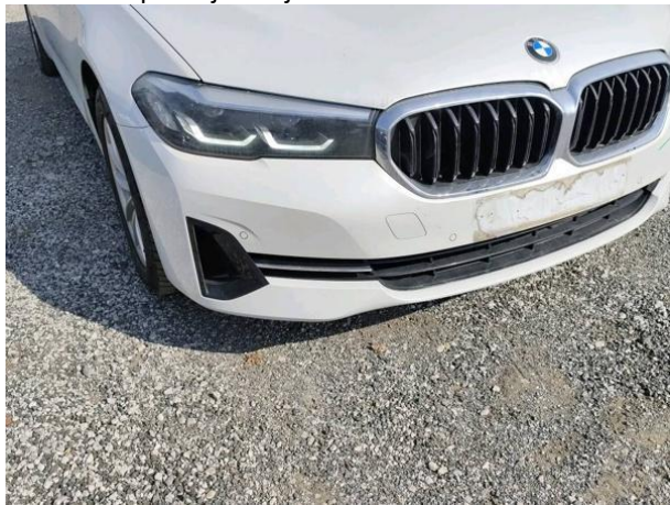
Slika R02: Sprednji odbijač