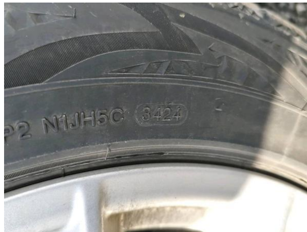
Slika G02: 1. os starost