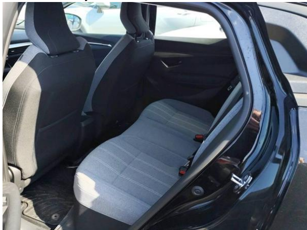
Slika N03: zadaj levo