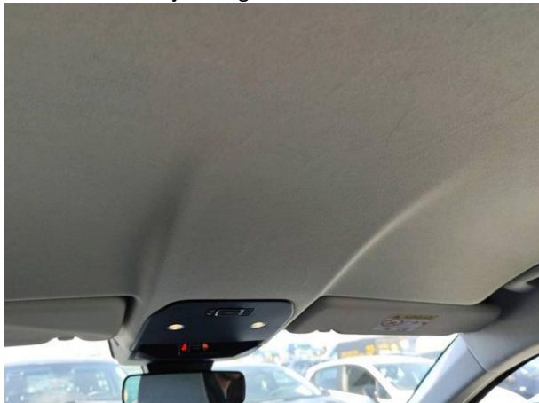
Slika N05: Notranja obloga strehe