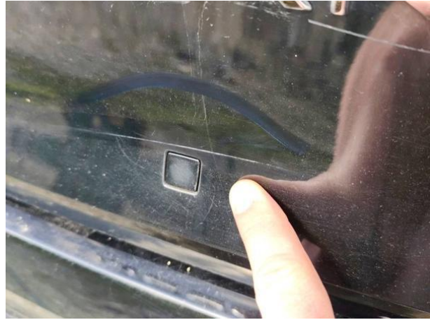
Slika R03-1: Poškodba