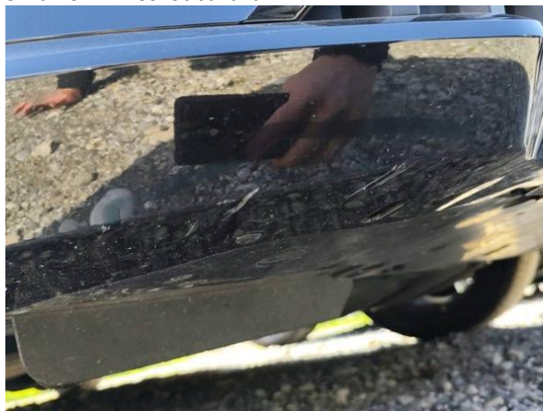
Slika R01-1: Poškodba laka