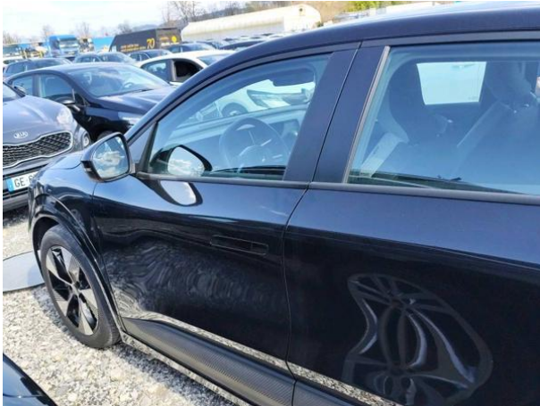
Slika R04: Sprednja vrata leva