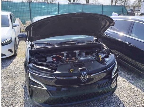
Slika M01: motorni prostor