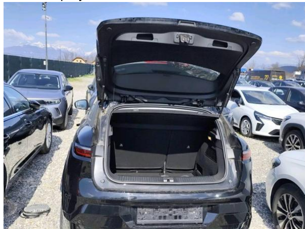
Slika N04: prtljažnik