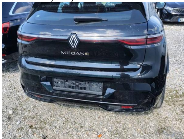
Slika R02: Zadnji odbijač