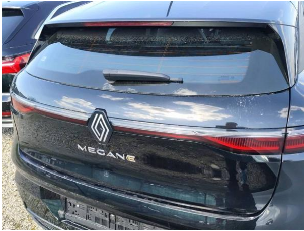
Slika R03: Pokrov prtljažnika