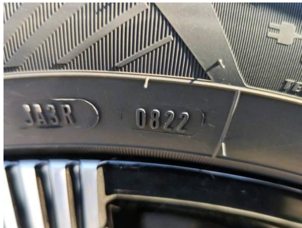
Slika G02: 1. os starost