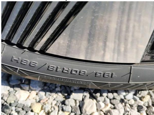
Slika G01: 1. os dimenzija