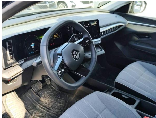
Slika N02: volan z opremo