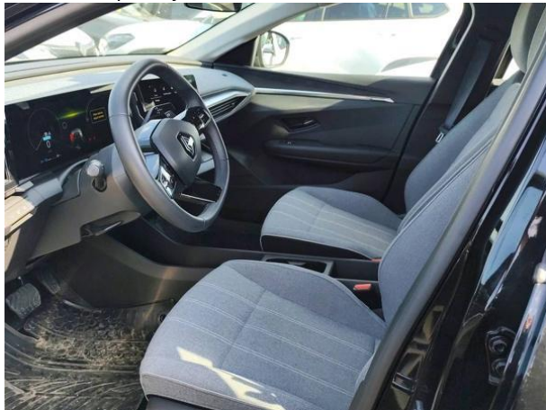
Slika N01: spredaj levo