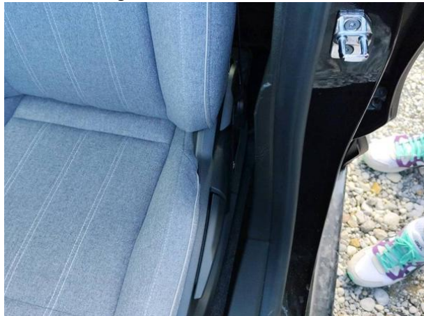
Slika N06: obloga stebrička