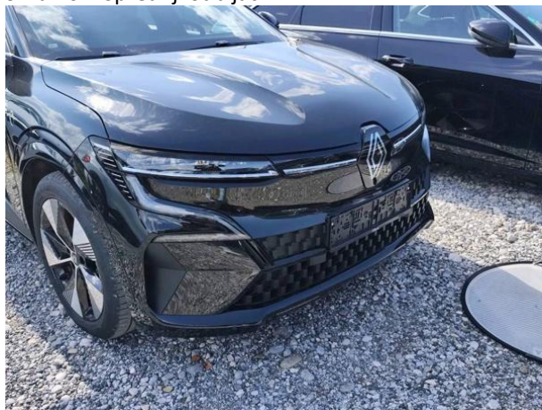
Slika R01: Sprednji odbijač