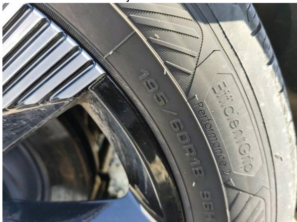
Slika G03: 2. os dimenzija