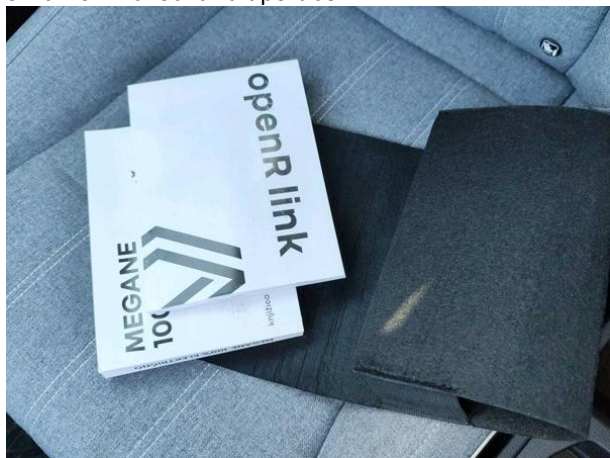
Slika D01: navodila za uporabo