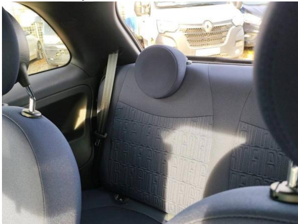
Slika N03: zadaj levo