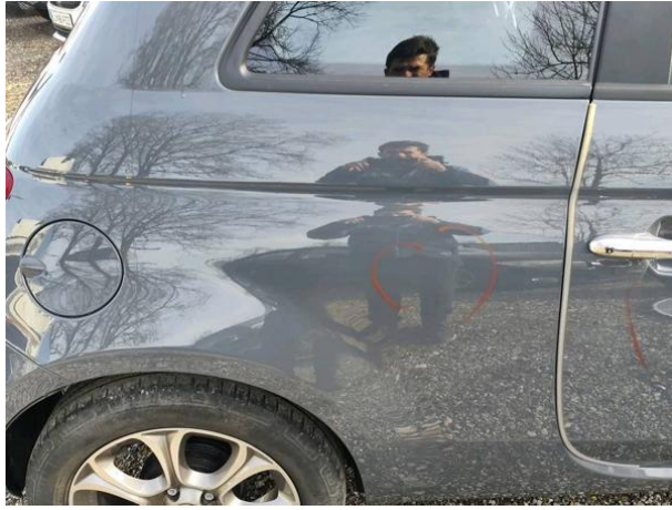
Slika R05: Stranica desna