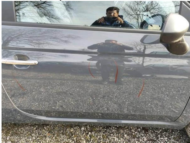
Slika R04: Sprednja vrata desna