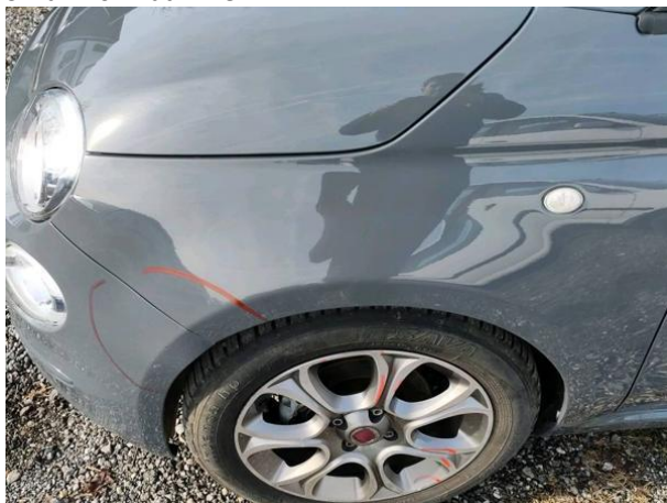
Slika R16: Blatnik levi