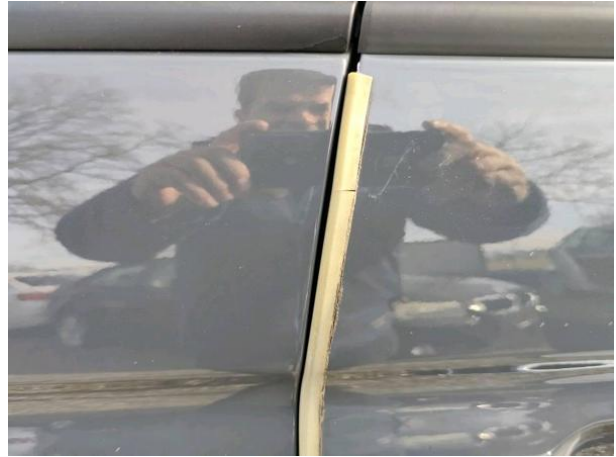
Slika R06-1: Poškodba