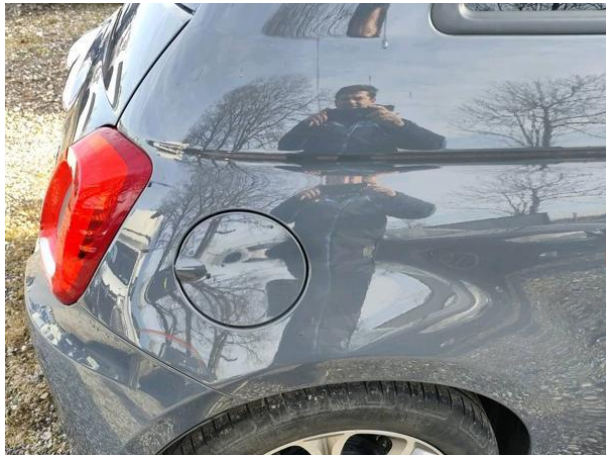
Slika R08: Stranica desna