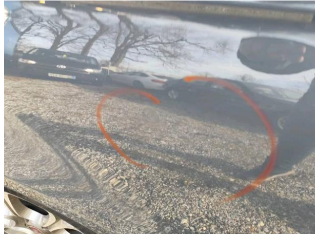
Slika R05-1: Poškodba