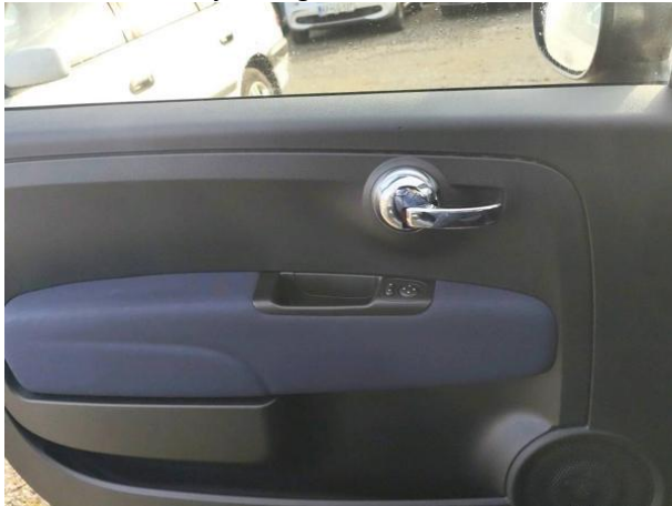
Slika N05: Notranja obloga vrat