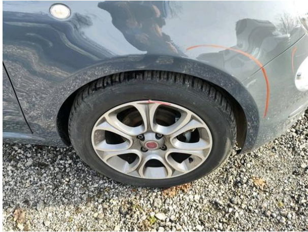
Slika R03: Al platišče