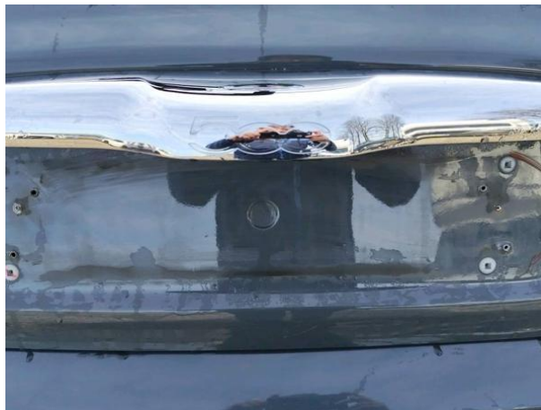
Slika R09-1: Poškodba