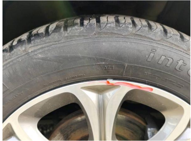
Slika R03-1: Poškodba