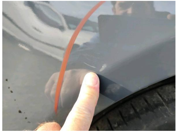
Slika R11-1: Poškodba laka