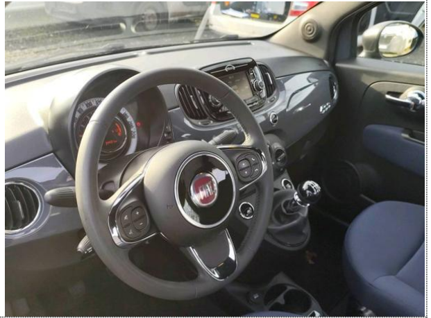
Slika N02: volan z opremo