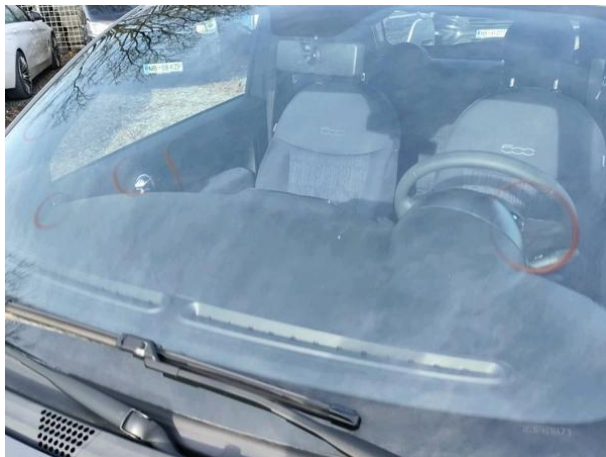
Slika R18: Vetrobransko steklo