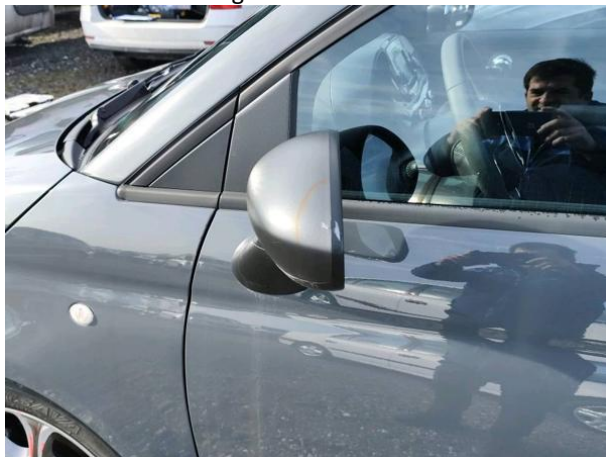
Slika R14: Vzvratno ogledalo levo