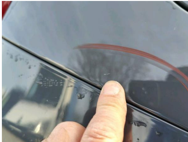
Slika R08-1: Poškodba laka