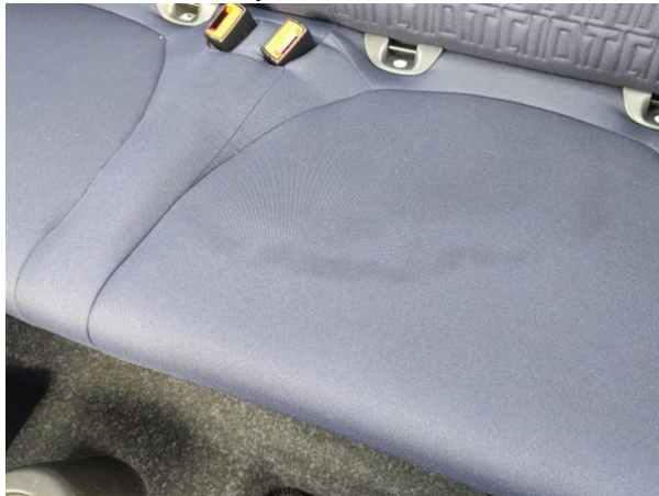
Slika N07-1: Umazanija