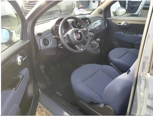
Slika N01: spredaj levo