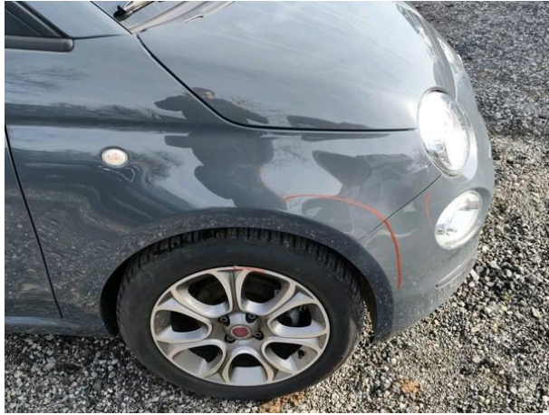
Slika R02: Blatnik desni