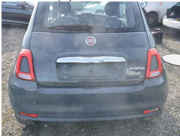
Slika R09: Pokrov prtljažnika