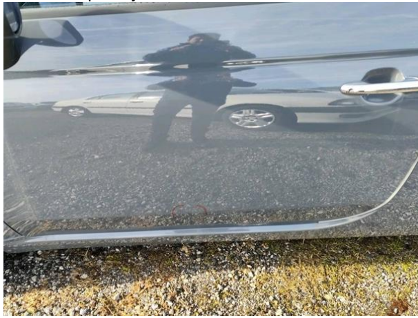
Slika R13: Sprednja vrata leva