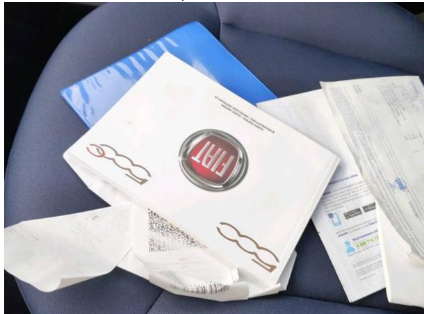
Slika D01: navodila za uporabo