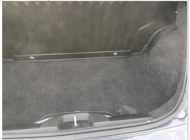
Slika N04: prtljažnik