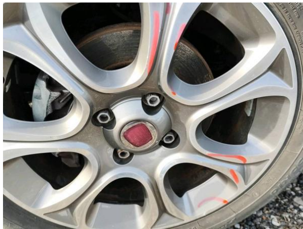
Slika R15-1: Poškodba