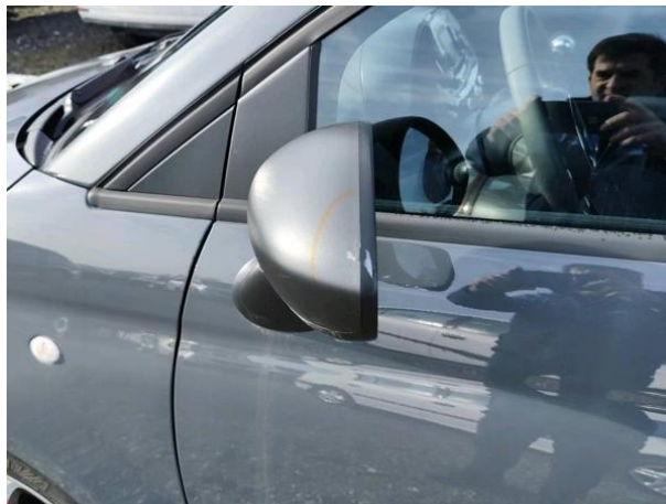
Slika R14-1: Poškodba