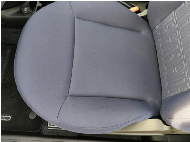
Slika N06: Sprednji levi sedež