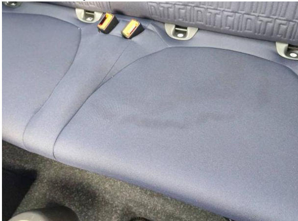
Slika N07: Zadnji sredinski sedež