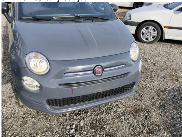
Slika R01: Sprednji odbijač