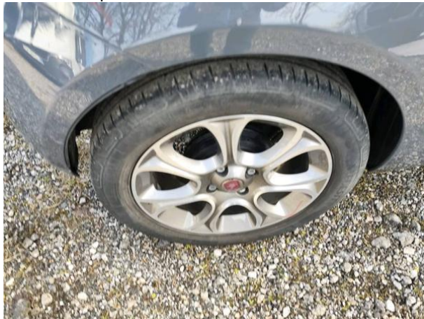
Slika R07: Al platišče