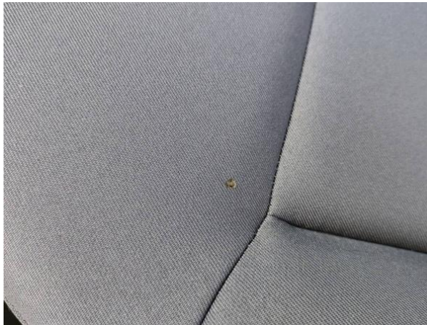
Slika N06-1: Poškodba