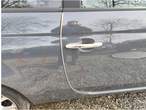
Slika R06: Varovalna guma