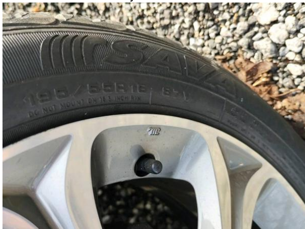
Slika G01: 1. os dimenzija