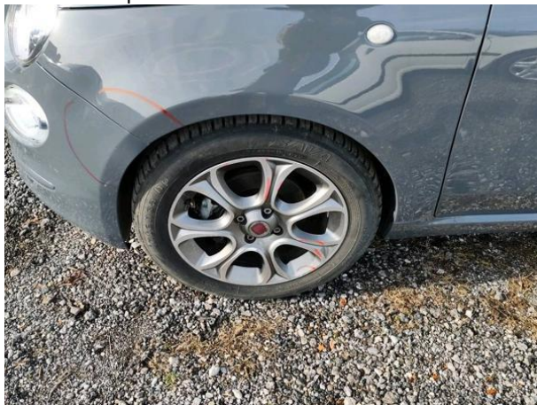
Slika R15: Al platišče