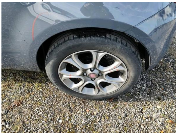
Slika R10: Al platišče