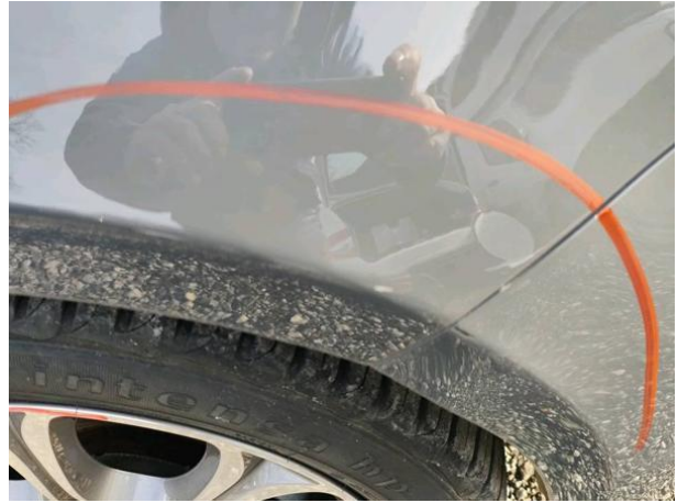
Slika R02-1: Poškodba