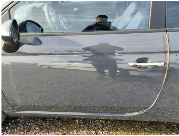
Slika R12: Stranica leva