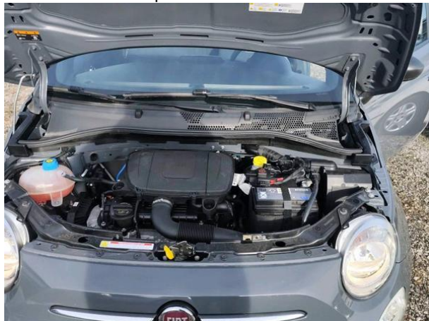
Slika M01: motorni prostor