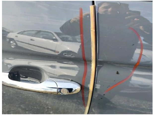
Slika R12-1: Poškodba laka