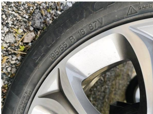
Slika G03: 2. os dimenzija