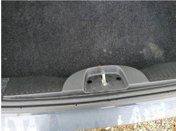
Slika N08: Obloga prostora za rez. kolo