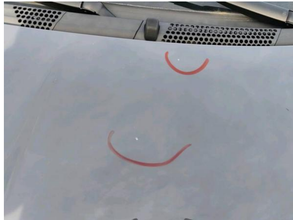
Slika R17-1: Poškodba laka