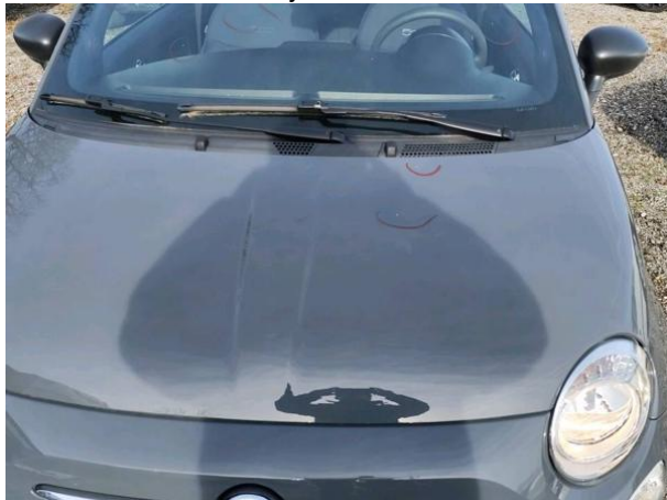
Slika R17: Pokrov motorja