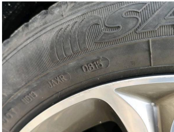
Slika G02: 1. os starost