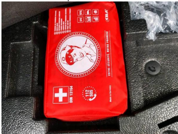
Slika O01: obvezna oprema